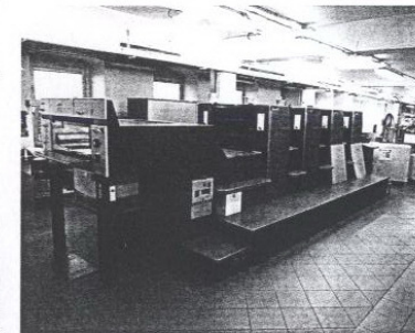
V provozu tiskárny je i čtyřbarvotiskový stroj Speedmaster SM 74-4-P-H

Tiskárna se dnes orientuje především na zákazníky z regionu, přičemž je tvoří jak přímé firmy, tak i agentury a grafická studia. Určitou část produkce pak tvoří také pražští zákazníci. Pro export je v tiskárně vyráběno jen velmi malé procento zakázek, spíše jde o jednotlivé výjimečné produkce, nepočítáme-li produkci diářů, které jsou vyráběny pro tuzemského zadavatele, jenž je exportuje i do okolních zemí. Mezi významné zákazníky, kteří dlouhodobě spolupracují s tiskárnou Ruch, pak patří zejména společnost Škoda Auto, pro niž jsou v tiskárně zpracovávány palubní dokumentace.