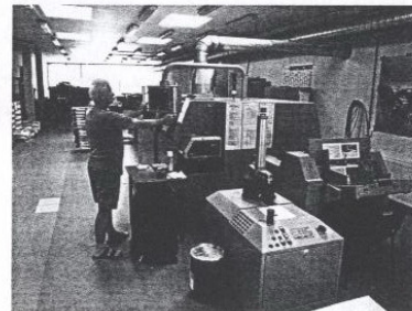
Pro zpracování vazby V2 je zde použita výkonná linka Panthera od společnosti Müller Martini

Silnou pozici má tiskárna Ruch také v segmentu dokončujícího zpracování, kde může nabídnout zhotovení všech základních operací, přičemž většinu z nich zajišťuje vlastními silami, pouze v vazby V8 využívá kooperaci se stálými partnery. Kromě zařízení, jako jsou jednohřízové řezačky či skládací stroje, je tiskárna Ruch vybavena i starší osmnáctistanovicovou snášeč linkou Setmaster Duplex s šitím drátem Vario, která byla v nedávno době doplněna o výkonnou snášeč drátošičku Stitchmaster ST 300. Silnou pozici má tiskárna také v oblasti zpracování vazby V2, kde byla lepička na zpracování vazby V2 Müller Martini